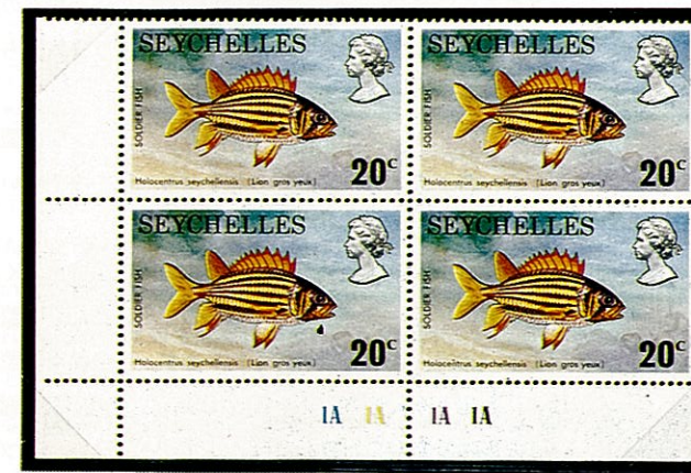
アヤマエビス セイシェル —1974—