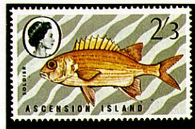
アオスジエビス A. tiere アセンション —1970—