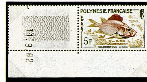
トガリエビス 仏領ポリネシア —1962—