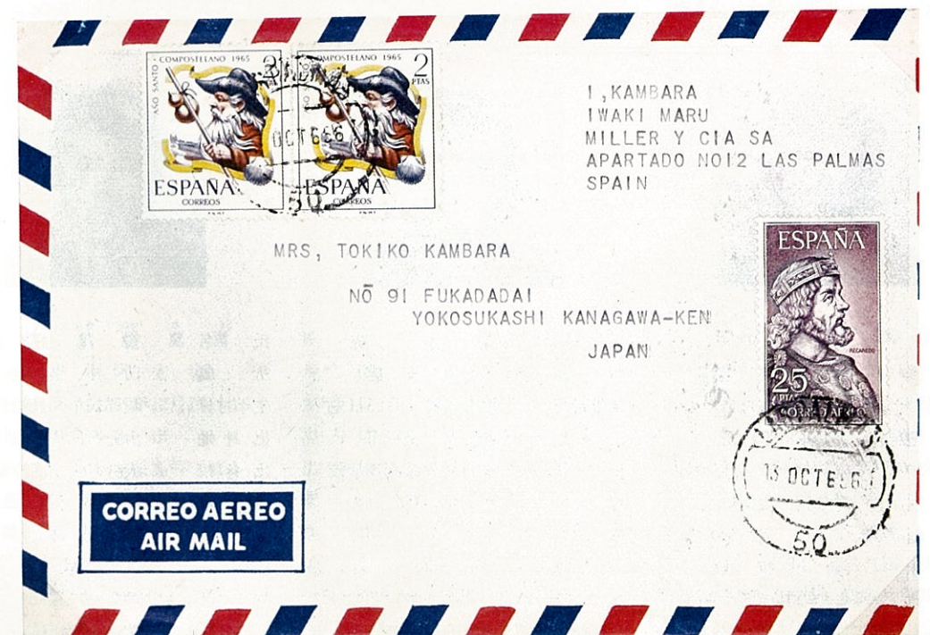
1966.10.13 カナリヤ諸島(スペイン領) ラスパルマス→横須賀