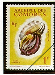
ウネショクコウラ