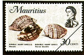
右 ミサカエショクコウラ 左 ウネショクコウラ