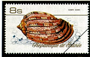
パライロショクコウラ H. doris