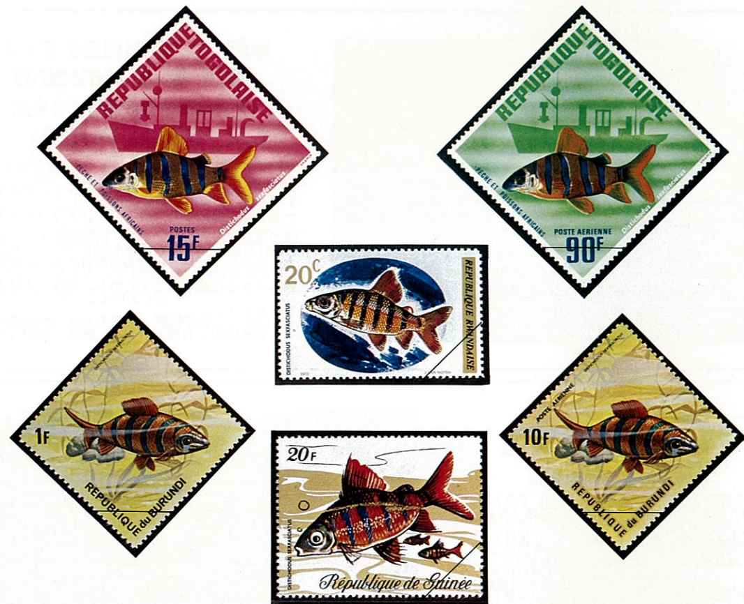
ノーズショート クラウンテトラ

原産地はアフリカのコンゴ(旧ベルギー領コンゴ)地方の淡水域で、体長40cmに達しカラシン科の中で最大の種とされている。淡水産熱帯魚の内でも大型の種類で、体側の横縞はスマトラ( Barbus tetrazona )とアマゾン河原産のレポリナス・ファシアタス( Leporinus fasciatus )を合せたような感じである。本属の最大の特色は背鰭が略々四角形に近いこと、口吻がやや突き出していること、及金色の体側に雄では顕著なる横縞が体を等分するように六本見えることで、雌はこの横縞がはっきり見られず不明瞭の縞模様となっている。