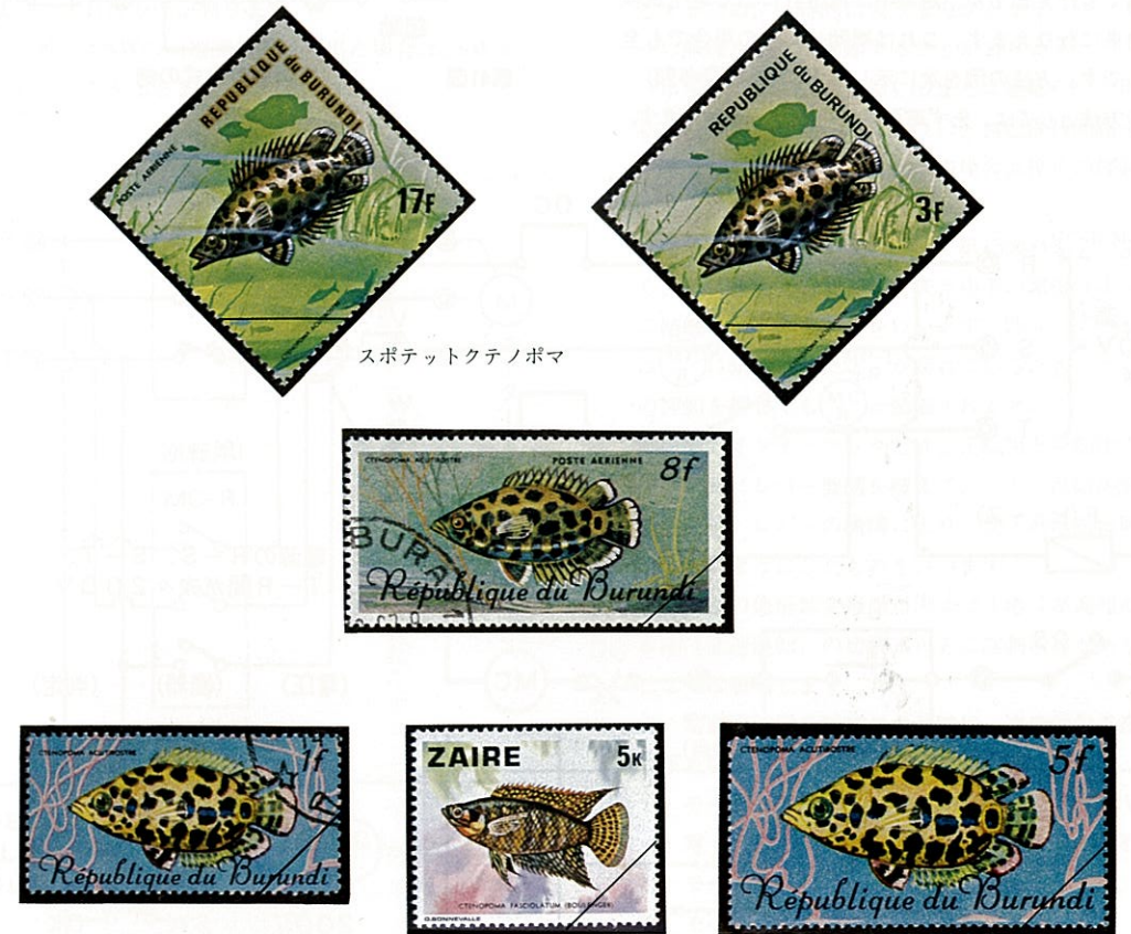
スポテットクテナポマ

西アフリカの熱帯淡水域特にコンゴ河の上流及中流が原産地で、大きさは約15cm位になる。体表に一面の数多の黒色斑紋があって、他種との識別は容易である。鱗は比較的大きく側線は途中で中断される。けんか好きのため他種との飼育は避けた方が良い。雑食性の大食漢で、小魚や水草の大きな切れ端など飲み込んでしまう。孵化時の水温は28℃～30℃と頗る高温で、卵殻は強い油成分のため、水表面近くを浮遊する。