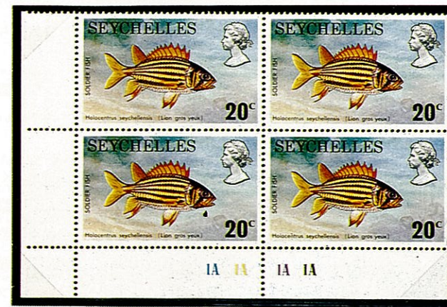
アヤマエビス セイシェル —1974—