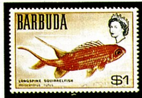
A. rufus バーブダ —1969—