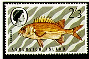
アオスジエビス A. tiere アセンション —1970—