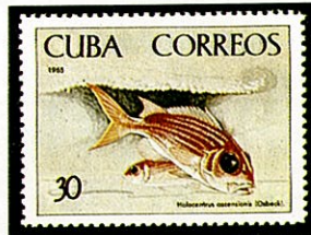
イトウダイ A. ascensionis キューバ —1965—