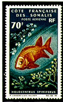
トガリエビス A. spinifer 仏領ソマリー海岸 —1966—