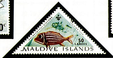
ニジェビス A. diadema モルジブ —1963—