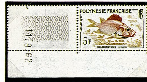
トガリエビス 仏領ポリネシア —1962—