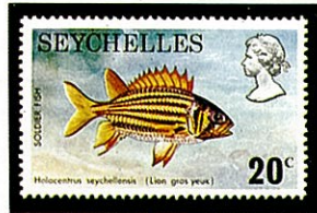
アヤマエビス Adioryx seychellensis セイシェル —1974—

世界中の暖海の珊瑚礁地帯、日本では中部以南の南西諸島や小笠原諸島に生息している。タイ型の海産魚で尾鰭はタイよりも小さく丸味をおびていて、頭は大きく強力な顎と大きな眼をもっている。鮮赤色の体色で、それぞれの鱗には白い点がありそれが作り出す縦縞は美しい対照をなして観賞魚として水族館になくてはならない存在である。鰓蓋の下方には後方に向かって大きな鋭いとげが突き出ている。群を作らず1尾ずつ行動をするがなわばり意識が強い。昼間は岩穴などにひそんで夜間小魚類を捕食する。浮袋、筋肉の振動によりかなりの大きな音を出す。体長は25cm、尻鰭の前の4本は鋭い棘で、特に3本目の棘が大きい。