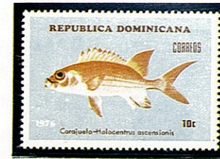
イトウダイ ドミニカ —1976—