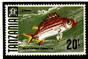
スミツキカノコ A. cornutus タンザニア —1967—