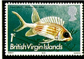
A. rufus 英領バージン諸島 —1975—