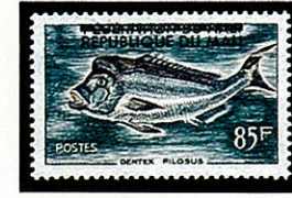
左に同じ マリ共和国 -1961-