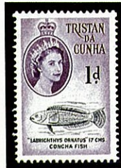
クロベラ類 Labrichthys ornatus -1960-