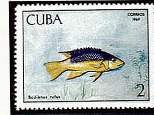
タキベラ属 Bodianus rufus キューバ -1969-