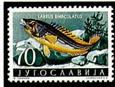
ナメラベラ類 Hologymnosus bimaculatus (Laburus) ユーゴスラビア -1956-

全世界の熱帯から亜熱帯海域の岩礁や珊瑚礁の良く発達した浅い海に生息する。日本では本州中部以南に分布し数十種が知られている。ベラ類は一般に雄が青味がつよく、雌は赤色のものが多い。又成長過程でその体色斑紋が著しく変化するものもある。同種のベラ類は同一海域に多く生息するが、統一された群をつくることはなく、単独に行動する。夜間は岩かげ、海藻の間、砂の中などに潜む。肉食性で小さな鋭い歯で海底の小甲殻類を捕食する。一般に体長は20cm位でコブダイ(カンダイ)のように1mを超えるものもある。ベラ類は小型で浅い岩礁地帯に多いため漁獲は困難であることと磯臭いのであまり食用にはされないが、コブダイ、キュウセンは可成り美味で賞味される。