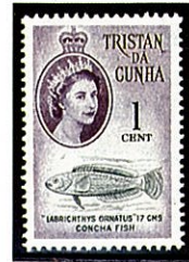
トリスダン グクニャ島 -1961-