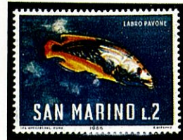
ニシキキュウセン Halichoeres melanurus サンマリノ -1966-