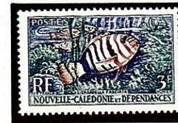
シチセンベラ Lienardella fasciata ニューカレドニア -1959-