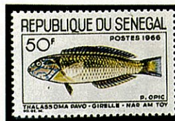
ヤマブキベラ類 T. pavo セネガル -1966-