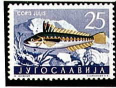
カンムリベラ属 Colis julis ユーゴスラビア -1956-