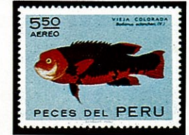
ヒレグロベラ類 B. eclancheri ヘル -1972-