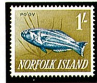
キヌベラ Thalassoma purpureum ノーフォーク島 -1962-