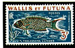
オトメベラ T. lunare ウォーリス・フーツナ島 -1962-