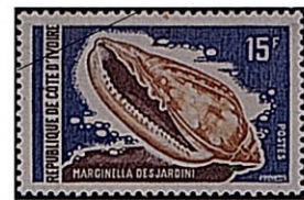
シラボシヘリトリガイ

一般に殻は小型で強靱、7mm～50mm位で普通25mm前後のものが多い。殻表はタカラガイに比較される位滑らか、螺塔は低い、殻口の軸唇に4ヶ以上のヒダがある、蓋はない。本種はコートジボアール（アフリカ西海岸）に分布し、沖合の100m位の砂底に生息するが稀種である。体高50mm。