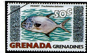
T. falcutus マルコバン的一种