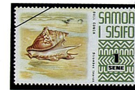
コツテイソデガイ S. taurus