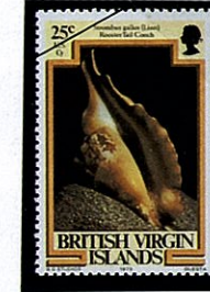
ルンバソデガイ S. gallus