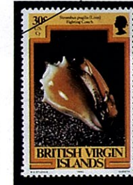
ソデボラ S. pugilis