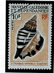
モンツキシソデガイ S. variabilis