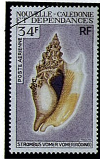
ウラスジマイノソデ S. vomer vomer