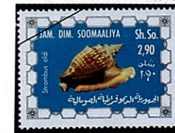
オールドソデガイ S. oldi