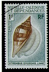
ホカケソデガイ S. epidromis