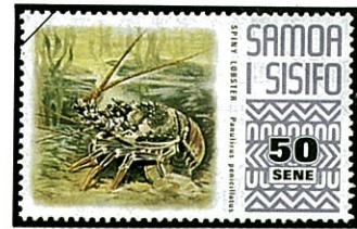
シマイセエビ P. penicillatus