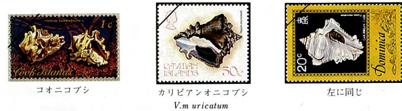
コオニコブシ カリビアンオニコブシ 左に同じ V.m uricatum

太平洋及び印度洋の亜熱帯から熱帯海域にかけての潮線下に生息する。殻は中型で8cm位、重厚堅固、殻表は殻皮に被われ、体層螺肋間に黒色の帯状の模様がある。螺塔は低く、円錐形で体層は頗る大きく、拳の如くにコブ状の突起をめぐらし、肩部のコブは最も大きく顕著である。殻口内唇には4~5条のヒダがあって蓋は角質の鈎状である。本科のものは、日本近海には少く、オニコブシ ( V. ceramicus ) と本種の2種のみである。