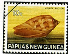
ラバウル コオロギ Cymbiola ruckeri