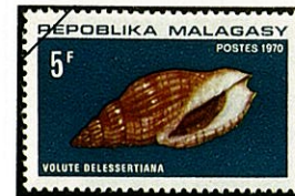
キサキ スジ ボラ Lyria delessertiana