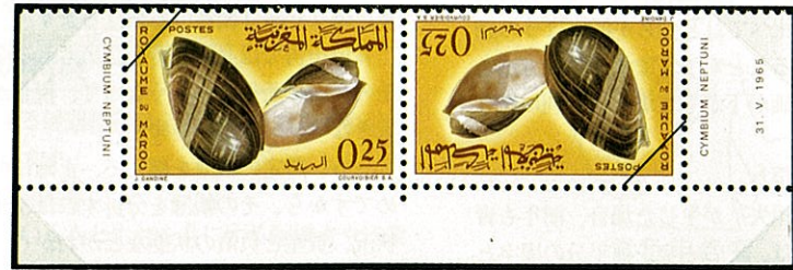
ナツメヤシ ガイ Cymbium pepo