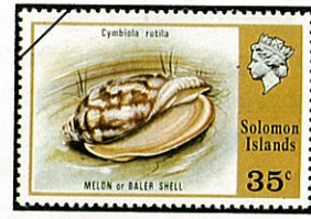
ショウジョウ コオロギ (右巻きが正) Cymbiola rutile