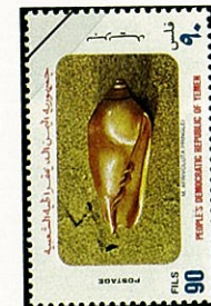
ワダツミ ボラ Afrivoluta pringleri