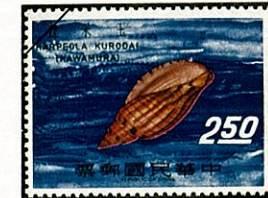
アデヤカ スノコ ボラ Lyria kurodai