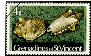
ガクフ ボラ Voluta musica