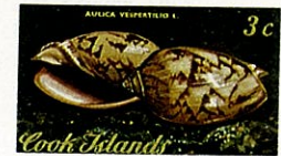
トウ コオロギ Cymbium vespertili