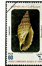
デュボン ゴクラク ボラ Alcithoe duponti