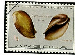
オミナ ハッカイ Cymbium cisium