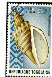
ゴクラク ボラ Alcithoe ponsonbyi