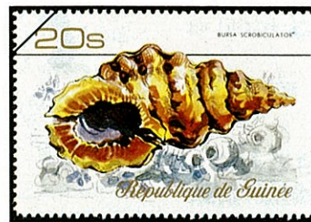
ギニアナルトボラ Bursa scrobiculata