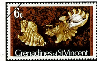
コオモリボラ C. femorale