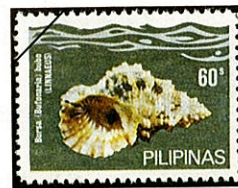
シワクチナルトボラ Bursa rubeta ( B. bubo は同定の誤り)