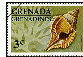
フロリダイボボラ