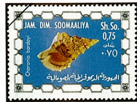
ソマリアボラ Bursa barclayi