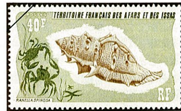
ミヤコボラ ( Ranella spinosa は同定の誤り)

太平洋、印度洋の温帯から熱帯海域の水深10m～20m位のところに生息する。殻は中型で重厚堅固、殻の両側左右には鱗状の隆起が見られ、その上に、牙状の突起がある。螺層には顆粒状の螺肋があって肩部および体層にはイボ状の突起が顕著である。殻口は長卵形で白色、水管は太く伸びる。外唇内縁および内唇内縁共に歯状のひだが見られる。