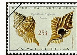
フロリダイボボラ Distorsio clathrata