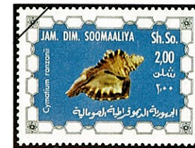
ソマリアフジツガイ C. rangani

全世界の温帯から熱帯にかけての10m～20m位の浅所に生息する。紀伊半島ではイセエビの刺網により漁獲されるが、数量は少ない。殻は毛の生えた殻皮に被われ、螺脈と縦脈とが交叉して小顆粒が見られる。殻の色は褐色と白色の帯が交互に数条あるが、個体差がある。殻の内縁は鮮朱褐色で内唇は反りかえって白色の数条のひだがあり、外唇は肥厚する。水管はや、長く、少し曲折する。和名のシノマキは殻表を取り巻く強い肋条の様子から篠巻きに由来する。