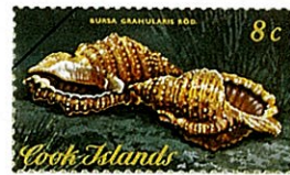
イワカワウネボラ Bursa granularis