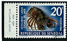
Scyllarus latus ヒメセミエビの一種

房総半島以南から太平洋、印度洋にかけての暖海に広く分布し、水深30~50m位の岩礁地帯や珊瑚礁のあるところに生息し、昼間は岩の穴やすきまなどに潜み夜間索餌活動をする。体長は35cmに達する大型種で、甲殻は著しく厚く堅固で、生時は一様に紅褐色で、尾扇は黄褐色である。甲の表面には小顆粒と粗毛に被われている。額角は将棋の駒の形状に似る。頭胸部は丸みのある略々方形でやや長い。5対の胸脚は短く頑丈で雌の第5脚には小さな鋏があるが雄にはない。腹部の側甲は良く発達し棘がある。尾節の後縁は丸い。南方諸地域では食用に供される。