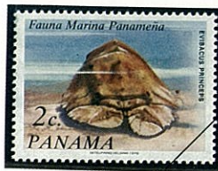
Evibacus princeps ウチワエビの一種