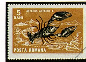
A. astacus ヨーロッパザリガニ