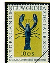
Cherax communis holthuis