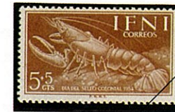
Procambarus sp アメリカザリガニの一種

日本の在来種であるザリガニは北海道日高山脈以南と岩手県と秋田県との間に分布する体長3~4cmの小型であるのに比べて、アメリカから渡来したアメリカザリガニ Procambarus clarki は体長10cmに達し在来種が北方地域に局限されて競争相手がなかったことと、水田という絶好の棲家に恵まれたことにより本州各地にまたたくまに広まり、一般にザリガニと呼ぶときには本種を指す程に普及している。川、沼、水田に生息し、稲などの植物の根を刈り取り食害する。サワガニなどと共に肺吸虫の中間宿主となる場合が多く生で食べるのは危険である。一般にザリガニはアフリカ大陸以外の各大陸に広く分布し、約300種ほど知られている。