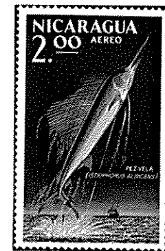
ニカラガ - 1969