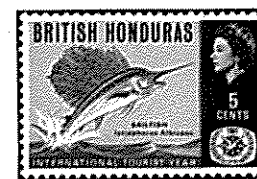
英領ホンジュラス - 1967