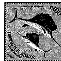
サルバドル - 1971