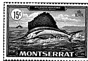
モンセラット - 1969