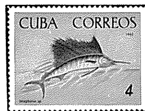
キューバ - 1965