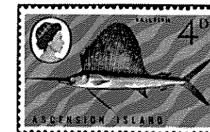
アセンション - 1971