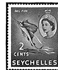
セーシェル群島 - 1934