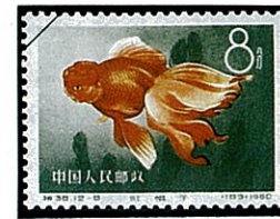
オランダシシガシラ