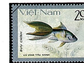
チンウエンユウイ(青文魚)