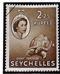
アルダブラゾウガメ