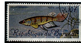
シックスバンド・パンチャックス