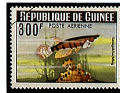
シックスバンド・パンチャックス

アフリカ西部のリベリアからコートジボアールにかけての淡水域に生息分布する。体長5～6 cm位で体型は細長く、体側に数条の横縞が見られる。雄は発情期が近づくと顎が真紅に染まり、華麗そのものである。習性は極めて温和しく、常に水槽の上部を泳ぎ25℃で産卵するが、卵は水草などに付着する。孵化した稚魚もまた表層から離れない。同属のシックスバンド・パンチャックス( E. sexfasciatus )は、体側の横縞が6本で体長はやや大きく10cm位。リベリアからザイールにかけて生息する。