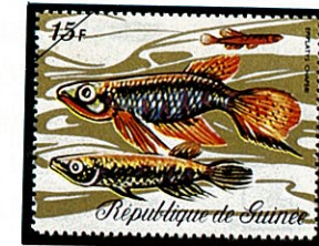
パンチャックス・チャッペリー