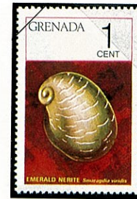
エメラルドカノコ Smaragdia viridis