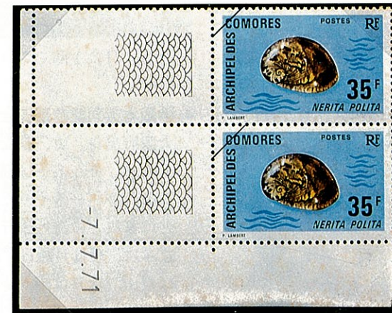
ニシキ アマオブネ