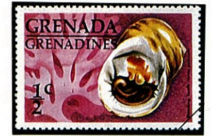
チダシ アマオブネ