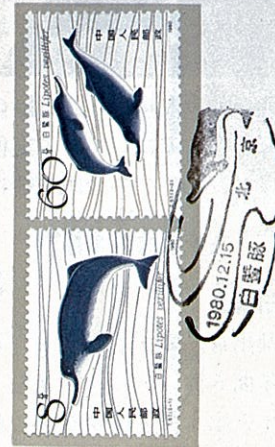
B—S.F. T.57 "The Chinese River Dolphin"

The Ministry of Posts and Telecommunications of the People's Republic of China released on December 15, 1980 a set of 2 special stamps entitled "The Chinese River Dolphin." Each stamp is 40 x 30 mm. Carefree and content.