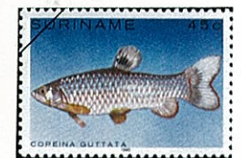
コペイナクッアタ Copeina guttata