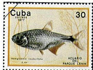
ブエノスアイレステトラ Hemigrammus caudovittatus