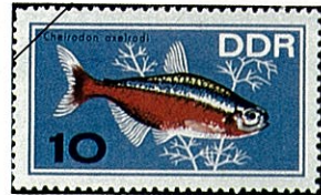
カーディナルテトラ Cheirodon axelrodi