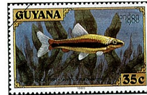
ゴールデンペンシルフィッシュ Nannostomus beckfordi