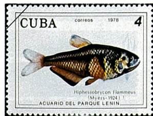
レッドテトラ Hy. flammeus