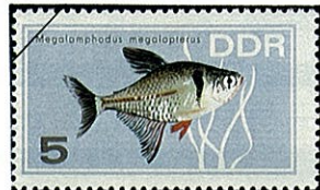
メガランホダス megalampodus megalopterus

アマゾン河のペルーとチリの国境近くの人跡未踏の支流が原産地で、体長は4cm位で雌雄の区別は産卵期以外は区別しにくい。体色は背部がやや透明の灰色で腹部は銀白色で眼を通る顕著なる空色の縦縞が第二背鰭近く迄延び、体側下半部から尾鰭近くまで赤紅色となって軽快なる美しさとなっている。食餌は雑食性で、強健で抵抗力が強く、他の魚との折合いも良い。水底のやや暗いところを好む性質がある。繁殖、孵化は困難な熱帯魚の一つである。近縁の Hemigrammus 属は尾鰭の付根にうろこがない点異なる。