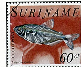
ブルーラインテトラ Astyanax fasciatus macrophthalmus