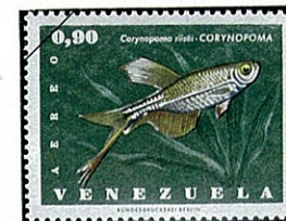
ソードテールカラシン Corymopoma riisei