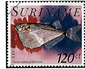
シルバンハッチェット Gasteropelecus levis