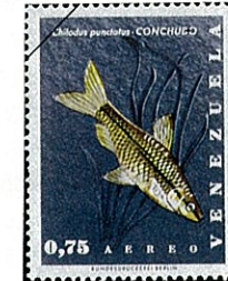
キロダスバンクティタス Chilodus punctatus