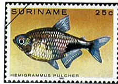
ガーネットテトラ Hemigrammus pulcher