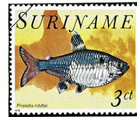
X線フィッシュ Pristella riddlei